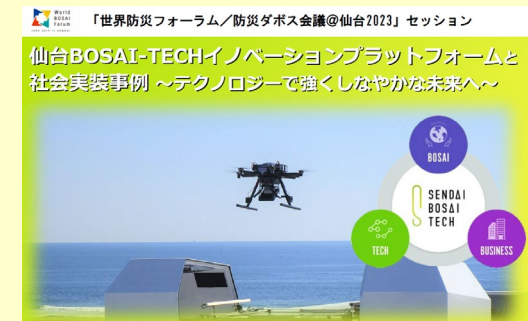
防テクPF会員への仙台市イベント 周知(R5.3)

※官民ネットワーク=自治体が「防災、レジリエンス、スマートシティ」等をテーマに民間と連携して行う会議体、プラットフォーム、事業（含むイベント）等と定義。