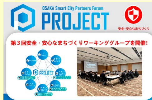
大阪府ワーキングでの防テクPF紹介 (R5.1)