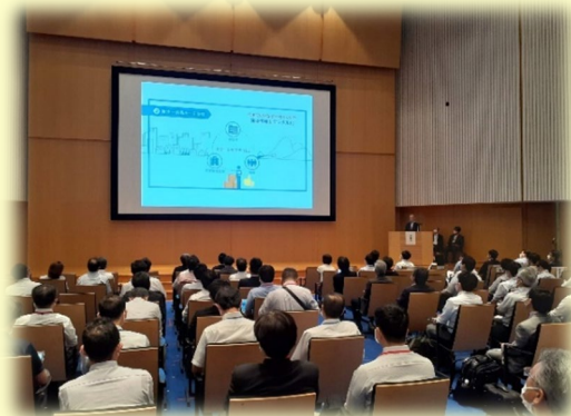
新潟県でのセミナー開催(R4.6)